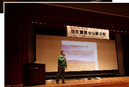
上から ・基調講演 ・活動報告2題