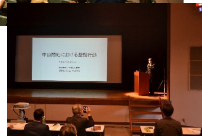
上から ・基調講演 ・活動報告2題