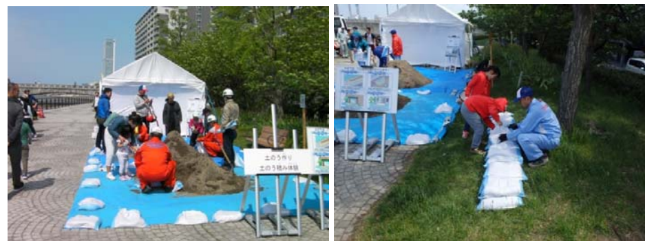
土のうづくり／積み土のう体験

やすらぎ堤は新潟市街地を流れる信濃川の緩傾斜堤で、都市における貴重な親水空間として市民の憩いの場となっている。一方、新潟市内はゼロメートル地帯が広がっており、水害に対する脆弱性を抱えている。こうしたことから、大型連休中ということもあって大勢の市民(家族連れ多数)が集まる機会に、このような取り組みを行うことは市民への啓発にたいへん有効であった。土のうづくり体験、降雨体験やアクアプレイは子供たちの人気を集め、低平地を守る排水機場の役割などパネルの展示・説明を通して治水事業の重要性や防災への認識が深まったと思われる。