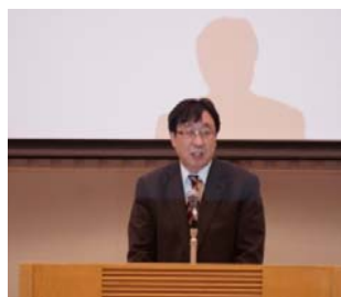
開会挨拶／基調講演

新技術・新工法における情報交換の貴重な機会として大変有意義であり、「今後も続けてほしい」との意見(アンケート：98%)や「様々な視点からの効率化や安全性向上に向けた発表を聞くことができ大変有意義だった」など、新技術に対する意識の向上が図られていた。また、基調講演では、i-ConstructionやCIMといったICTツールを用いた生産性向上など時宜を得た話題を提供し、今後もこのような基調講演を取り入れてほしいとの要望を得た(アンケート：88%)。