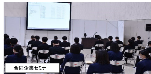
合同企業セミナー