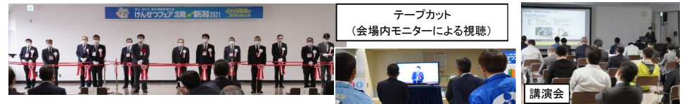
テープカット (会場内モニターによる視聴)

出展者アンケートにおいても「他企業の新技術を観覧、非常に有意義なイベントであった」などの意見があり、8割以上が『次回以降も出展を望む』結果となり、来場者だけでなく出展者にとっても大変有意義な事業であったことが伺える。