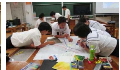
中能登中学校生徒が町内防災マップを作成