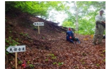
国道289号「八十里越」ルート整備