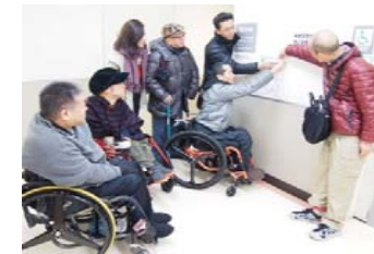
作成したユニバーサルトイレマップの掲示の高さを確認