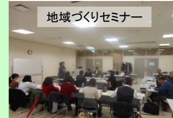
地域づくりセミナー