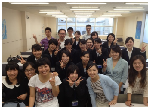
① オリエンテーション