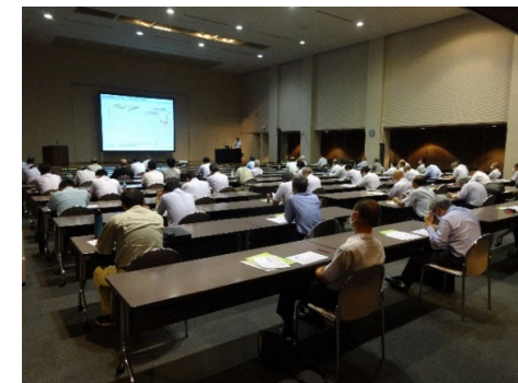
第24回状況(新潟会場)