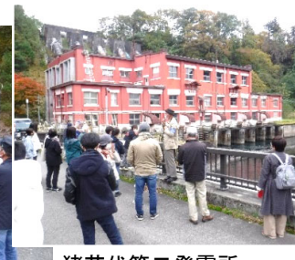
猪苗代第二発電所