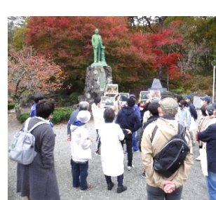
戸ノロ十六橋水門