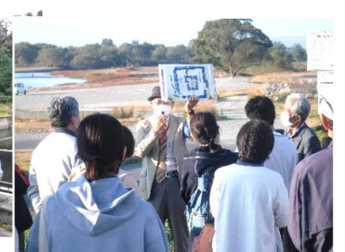
南四合水質浄化施設