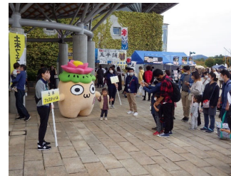
←公園入場口 ↓屋外会場

また、会場が越後丘陵公園のため家族連れも多く、近年課題となっている「担い手確保」の側面からも効果が期待される。