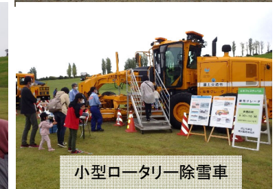
小型ロータリー除雪車