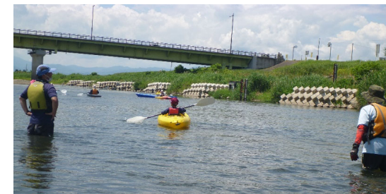
7/10 カヌー体験、川流れ