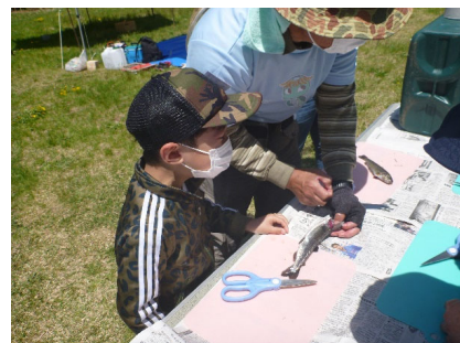
5/15 魚を釣って食べよう

川での体験活動を通じて河川愛護の精神が育まれ、河川の利用促進や自然環境への理解の向上が期待できる。また、かつて参加した小中学生が成長する中でこの活動を手伝うようになり地域貢献の一助となるなど、「川への思い」が後の世代へと綿々とつながっている。