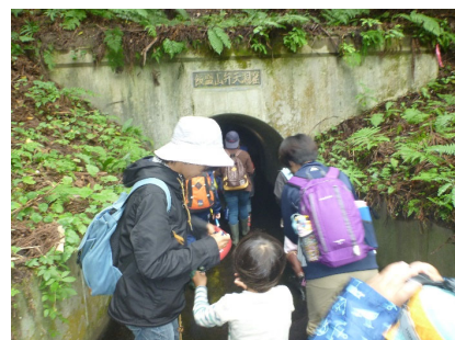
10/2 戸ノ口堰洞門くぐり