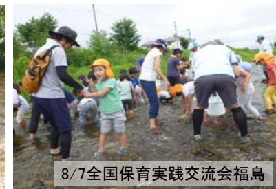
8/7全国保育実践交流会福島