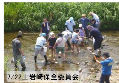
7/22上岩崎保全委員会