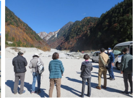
七倉ダム上流不動沢からのマサ土流出状況