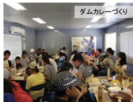
ダムカレーづくり