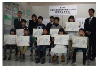
審査会・表彰式の様子