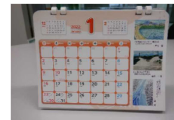
優秀作品を掲載したカレンダー