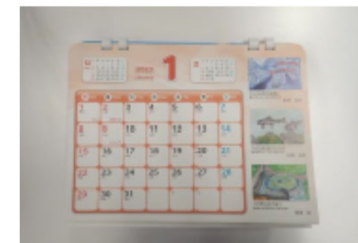
優秀作品を掲載したカレンダー