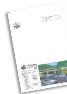
入賞作品の掲載・活用 ・封筒デザイン ・ホームページ