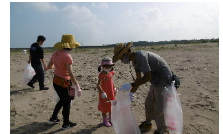
金石海岸清掃活動