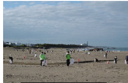
県内清掃統一デー

本事業は、身近な環境ボランティア「海岸愛護運動」として平成7年から展開されている。自然生態系を構成する山～川～海をつなぐ全県一斉の運動が必要との認識から、県内全市町村が参加する「県民運動」となっており、これまでの参加者はのべ250万人を超える。 平成13年の第21回全国豊かな海づくり大会では、漁場保全部門の最高賞である大会会長賞を受賞。地域住民や自治体・企業・団体等からの参加や支援により、環境保護・社会貢献への関心を高める効果がある。