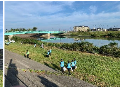
第38回「梯川ごみ拾い」