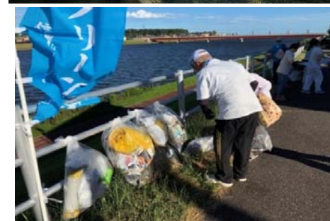
会員団体による活動状況