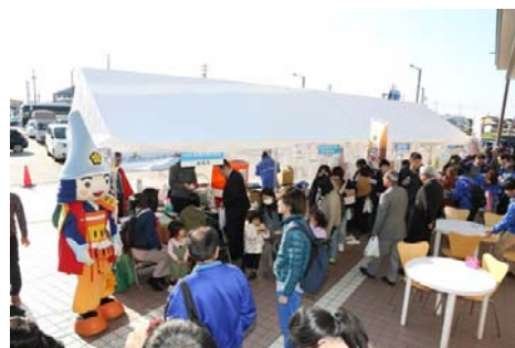
能越道沿線物産市