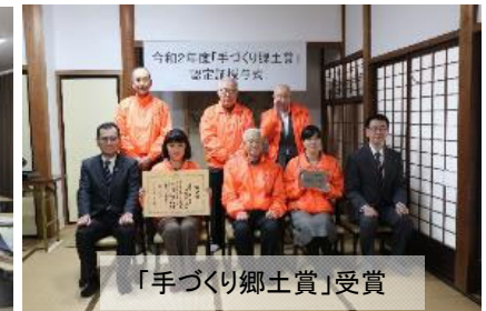
「手づくり郷土賞」受賞