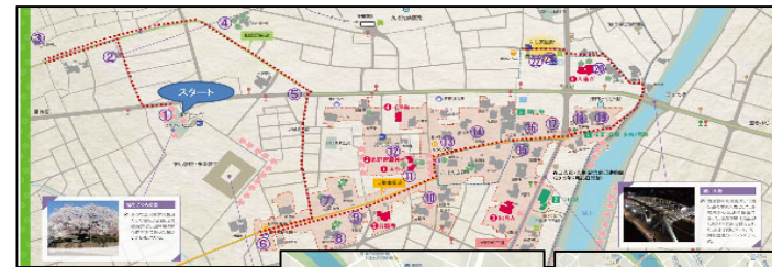
散策モデルコース マップ

当該地域は、日本風景街道の取り組みや歴史的建造物等の保存活動に地域を挙げて取り組む土壌ができており、本事業によって、今後さらに地域の一体感の醸成やそれによる地域活動の活性化が期待できる。 平成18年の設立以来、PDCAサイクルによる主体的・継続的な取り組みを続けており、マップの更新・活用等を通じ、街道機能の多様化や地域資産の再認識など美しい道・まちづくりが促進される。 その活動が認められ、令和2年度国土交通大臣表彰「手づくり郷土賞」(一般部門)を受賞した。