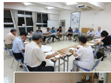
地域の魅力発信 ワークショップ

当該地域は、日本風景街道の取り組みや歴史的建造物等の保存活動に地域を挙げて取り組む土壌ができており、本事業によって、今後さらに地域の一体感の醸成やそれによる地域活動の活性化が期待できる。 また、アンケートや満足度調査の実施によって、隠れた地域の魅力の掘り起こしや今後の課題等も発見できるため、それらを反映したパンフレットの作成による情報発信効果は極めて高い。PDCAのサイクルによる継続的な取り組みとして、地域が主体的に、継続的に管理運営できる仕組み作りも可能であり、一定の効果が見込める。