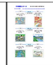
ホームページでの公表