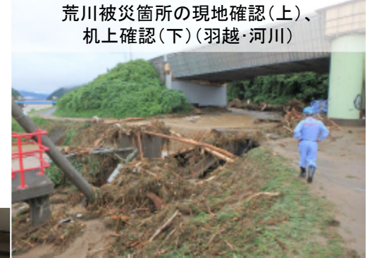
荒川被災箇所の現地確認(上)、机上確認(下)(羽越・河川)