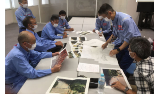
R113被災箇所の現地確認(上)、事務所での事前打合せ(下)(新潟国道)