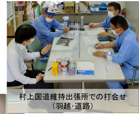
村上国道維持出張所での打合せ(羽越・道路)