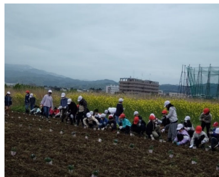
ネモフィラポット苗植え付け

NPO法人徳合ふるさとの会は、「季節を彩るフラワーロード」を目標に「日本風景街道」の活動団体として四季の花を主体にした道路・河川整備活動を行っている。 本事業では、緑化活動を通じ子供たちに自らが学び、考える力を育むとともに、地域の魅力向上によって散歩、ジョギング、お年寄り、園児など多くの方が訪れる(R4は累計1万人超)名所となりつつある。引き続き、ホームページやSNSを通じてさらなる広がりが期待される。