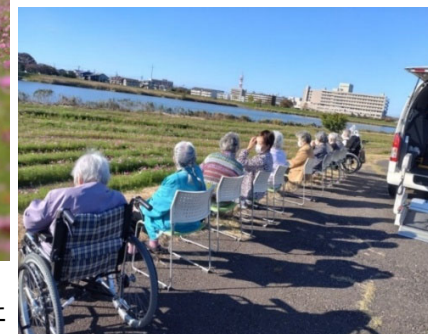
市民の憩いの空間に