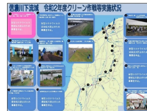
活動状況をホームページで公開