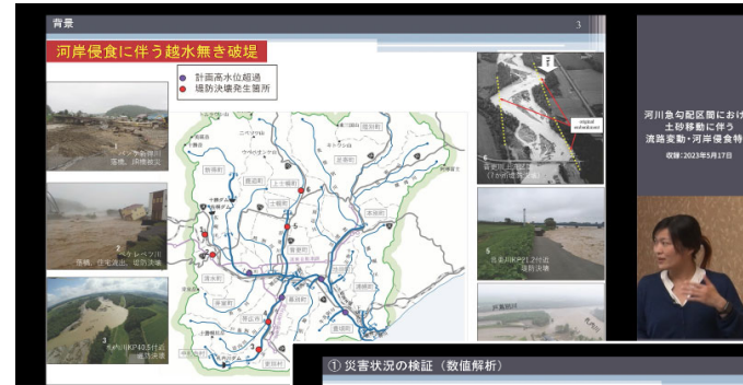
視聴画面イメージ

アンケートの回答に対し受講証明書を発行する仕組みとしており、視聴者から多くの意見・感想を集められ、講師と共有することで研究活動への反映が期待される。また、アンケートからは熱心な視聴状況がうかがえ、事業の継続が望まれている。