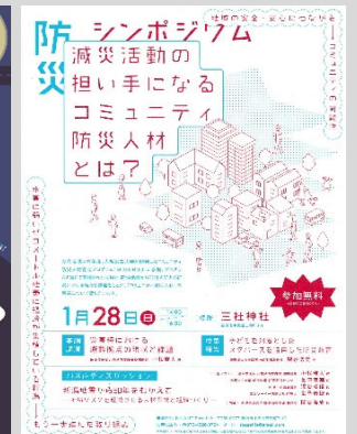
防災シンポジウムチラシ (T-Base-Life)