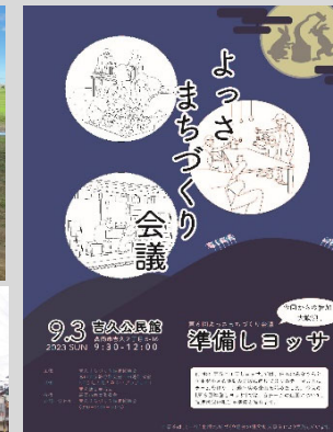
「よっさまちづくり会議」チラシ (「低未利用地活用による持続的コミュニティプログラムの可