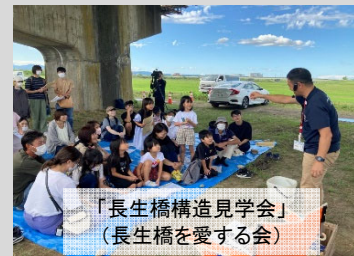
「長生橋構造見学会」 (長生橋を愛する会)