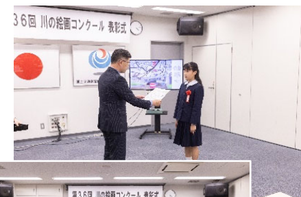
↑ 低学年 高学年 →