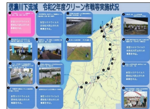
活動状況をホームページで公開