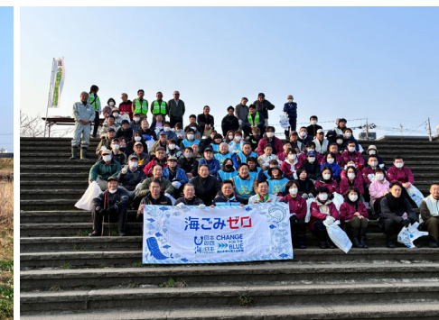
第45回「梯川ごみ拾い」